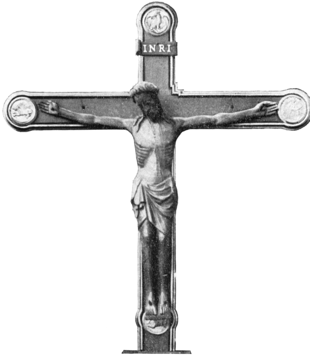
3. Het H. Kruis overleefde de beeldenstorm evenals een brand van de oude kruiskapel in 1585.

De stijl van het kruisbeeld “Zwarte God van Hoboken” 3 is met uitzondering van de armen, welke later vernieuwd zijn, toe te wijzen aan de 12 de eeuw. 4 Jezus Christus heeft een lengte van 1,63 meter en een grauwwartachtige kleur. Het beeld toont kleine beschadigingen. Onder de borst is een kruisgewijze holte waarin een gedeelte van het waarachtig kruis van Christus zou ingesloten zijn. Indertijd bewaarde men de relikwieën van heiligen in de beelden. 5