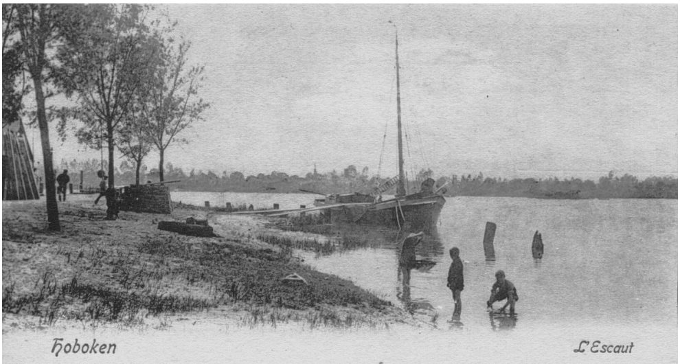
2. Oude foto van de Schelde nabij Hoboken bij Antwerpen.

Om de geschiedenis te bewaren werden op 25 april 1618 de herinneringen van “drie bejaarde en geloofbare personen” in een notariële akte genoteerd. Zo verklaarden zij: “dat het beeld van het H. Kruis van Hoboken, hetwelk tegenwoordig binnen de voornoemde kapel van Hoboken nu andermaal is verheven, oud te zijn tussen de vijf- en zeshonderd jaar, en dat in hetzelfde beeld zou berusten een weinig hout van het H. Kruis van onzen Zaligmaker Jesus Christus. Welk beeld met den vloed onder het veek of oud riet tot Hoboken zou aangedreven zijn. En ditzelfde is vereerd geweest, eerst in een kleine kapelleken, dat nadien tot twee of drie keren vergroot werd, zoals men het nog aan het metselwerk van de gevel der kapel kan bemerken. Ook nog gehoord te hebben dat hun voorouders altijd hetzelfde beeld in grote eer hebben zien houden en dat er jaarlijks grote devotie was. Ook gezien te hebben dat dezelfde kapel met vele kabels van schepen, ijzeren ketenen, boeien, krukken en harnessen van binnen was behangen, die aldaar door mirakelen, zo men zegde, geofferd werden. En gezien de grote begankenissen van de zeevaarders, die in dezelfde kapel hun kabels van hun schepen offerden op het goed succes van hun zeevaart, werd dezelfde genoemd de Schipperskapel door de menigvuldige bedevaarten, die de voornoemde comparanten door de zeevaarders in de vermelde kapel hebben zien doen” . 1