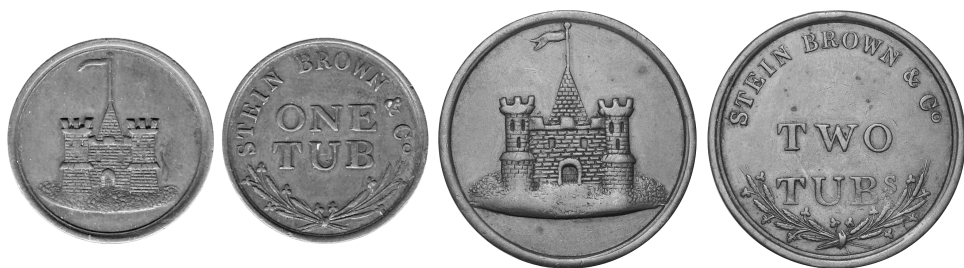
2 penningen van de whiskystokerij "Stein Brown & Co"