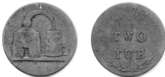
penning van de whiskystokerij "Stein Brown & Co"