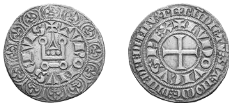
Tourse groot Louis IX, waarde 12 denieren

nieuwe grote zilvermunt namelijk de Tourse groot die Louis IX na 1260 in omloop bracht en al heel snel zeer populair werd.