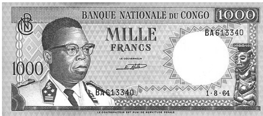
1000 frank 1964, president Kasa-Vubu, 172 × 75 mm