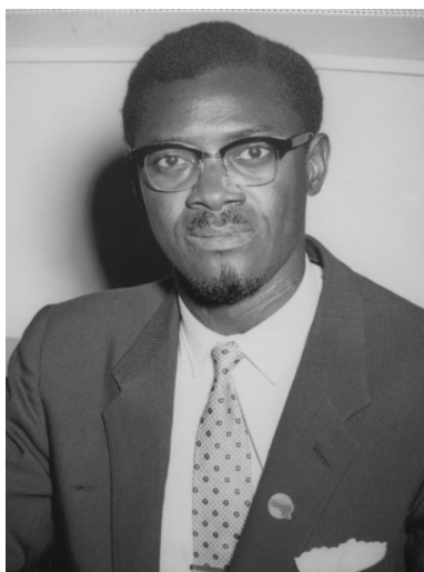
Patrice Emery Lumumba (1925-1961)

1958 zou een sleuteljaar worden. De eerste locale verkiezingen werden georganiseerd die ene Joseph Kasa-Vubu burgemeester maakte van Dendele, een zwarte gemeente. Op dat moment waren alleen Ghana en Soedan onafhankelijk in zwart Afrika, maar Charles de Gaulle beloofde dat jaar ook de onafhankelijkheid aan Congo-Brazzaville. Overal kwamen er reacties los en kort nadien werd de politieke partij MNC (Mouvement National Congolais) door Patrice Lumumba gesticht. De wereldtentoonstelling Expo 58 te Brussel had een Congolees paviljoen en honderden Congolezen konden voor de eerste keer België bezoeken. Het schudde de Congolezen verder wakker.