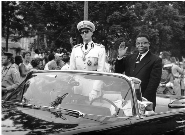
Koning Boudewijn en president Kasa-Vubu tijdens de triomfantelijke optocht van 30 juni 1960

Joseph Kasa-Vubu werd president van Congo en Patrice Lumumba eerste minister, twee rivalen uit verschillende politieke partijen, waartussen het niet boterde. Lumumba predikte het unitarisme, waardoor de rijkdommen van de welstellende provincies ook de rest van Congo ten goede zouden komen, en toonde zich voorstander van verregaande sociale hervormingen. Hij geloofde dat er welvaart kon komen, mits de Belgen maar buiten te gooien en alles in eigen handen te nemen. Eigenlijk was dit totaal onrealistisch, want daar waren nauwelijks lokale mensen voor opgeleid. Dat alles schoot in het verkeerde keelgat bij vele westerse landen, en hij werd als communist afgeschilderd en tegengewerkt. Al in de eerste weken na de onafhankelijkheid staakte de Force Publique (het leger en tegelijk politie), die wilde dat de Belgische officieren eruit gegooid werden. De zwarten keerden zich tegen de blanken en er waren moordpartijen en verkrachtingen. Een grote exodus van de Belgen kwam op gang.