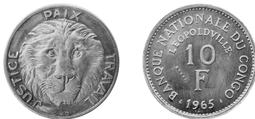
Proefslag 10 frank 1965 in zilver met ESSAI op de keerzijde

De datum voor de officiële plechtigheid werd vastgelegd op 21 april 1965 in de KMB, toen nog gevestigd in Sint-Gillis Brussel, in aanwezigheid van de ambassadeur van Congo J. Kahamba en onze minister van Financiën A. Dequae. De ambassadeur ontving een gouden en zilveren proefslag ter herinnering. Er werd hem ook een gouden en zilveren proefslag overhandigd voor de gouverneur Albert Ndele Mbamu van de BNC.