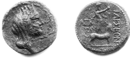
Tarsus, bronzen munt 2/1 ste eeuw v.C., 6,00 g, 19 mm

dezelfde afbeelding in een piramidiaal monument (een zgn. pyra ) met een adelaar erboven.