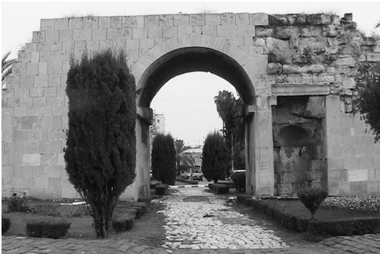
De Poort van Cleopatra te Tarsus

In deze stad is de heilige Paulus geboren en ontmoette Marcus Antonius zijn geliefde Cleopatra voor de eerste keer. Ondanks haar rijke geschiedenis is er in Tarsus vrijwel niets behouden gebleven.