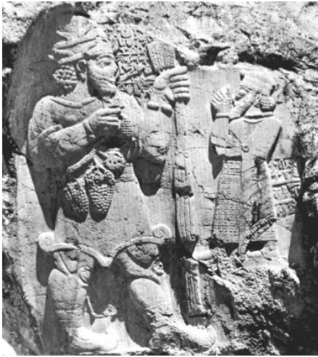
Afbeelding van Sandan op dit rotsreliëf van Ivriz?