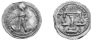
3. Ardashir I, gouden 1/6 dinar, 1,52 g, 14 mm (schaal 3/2)

Ardashir liet door middel van zijn munten duidelijk weten dat een nieuwe dynastie over het Perzische rijk heerste. De munten zijn geen imitaties van andere muntreeksen maar nieuwe artistieke meesterwerken. Soms oogt de buste van de koning nog Parthisch, maar bij latere types merken we de duidelijke ‘Sassanidische’ stijl. Steeds wordt een gedetailleerd portret van de koning op de voorzijde van de munten getoond, en een vuuraltaar op de keerzijde.