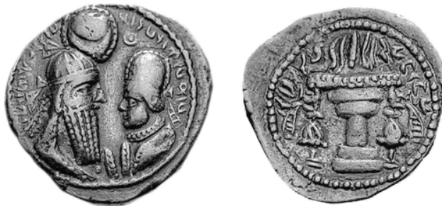
4. Ardashir I, koperen octachalkoi (unit), 11,02 g, 26 mm (schaal 3/2)

Gezien het beperkt aantal gouden munten dat van deze koning werd teruggevonden, mag worden verondersteld dat deze enkel bij bijzondere gelegenheden werden geslagen. De gouden munten betreffen dinars, dubbele dinars en 1/6 dinars. De dinar had een waarde van 12 drachmen.