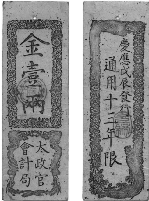
Bankbiljet van 1 ryo Dajokan satsu, Meiji jaar 1 (1868), 133 x 45 mm, op de voorzijde bovenaan: 金壹兩 (goud 1 ryo, van boven naar onder)

Keizer Meiji voerde dus in 1871 een munthervorming door om mooie ronde munten te maken met decimale waarden naar westers model. Een nieuwe munteenheid werd gekozen: de yen, onderverdeeld als volgt: 1 yen = 100 sen (centiem) en 1 sen = 10 rin. De yen werd gelijk gekozen wat betreft gewicht en afmetingen aan de Mexicaanse dollar, de destijds meest verspreide wereldmunt, om hem gemakkelijk aanvaardbaar te maken buiten Japan.