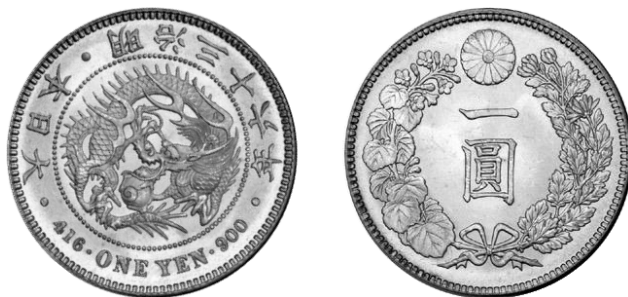
1 yen Meiji jaar 36 (1903); op de voorzijde: • 大日本 • 明治三十六年 • 416 · ONE YEN · 900 (groot Japan, Meiji jaar 36 = 1903, van rechts naar links); op de keerzijde: 一圓 (1 yen, van boven naar onder)

De muntstukken in yen werden zeer mooie muntstukken naar oosterse normen, gegraveerd door Kano Natsuo. De voorzijde toont een draak die een juwelenkistje vasthoudt. De keerzijde toont de rijzende zon met rondom een lauwerkrans, een chrysantheem en paulowniabladeren, beide keizerlijke symbolen (zie blz. 1). De yen was als munt zeer succesvol en omdat vele yens als handelsmunt circuleerden in Hong Kong en China werd vanaf 1874 de tekst ONE YEN, het gewicht 416 (grains) en het gehalte 900 (‰) bijgevoegd (of alleen de waarde op de kleinere munten) terwijl op de keerzijde de rijzende zon plaats maakte voor de tekst 1 YEN, in Kanji geschreven van boven naar onder. Deze munten werden geslagen tot 1914. (Nota: de grain is een oude Engels-Amerikaanse gewichtseenheid, 1 gram = 15,432 grains).