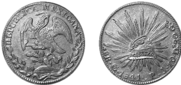
De Mexicaanse dollar, 8 reales Mexico 1841

De nieuwe muntwet van mei 1871 adopteerde de goudstandaard, in navolging van de meeste westerse landen, waarbij 1 yen gelijk werd aan 1,5 g goud. Ze voorzag een omwisselkoers van 1 yen voor 1 ryo voor bankbiljetten en diverse koersen voor de munten volgens de metaalwaarde.