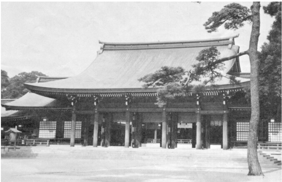
Het Meiji-schrijn in Tokyo.

Keizer Meiji overleed in 1912. Hij was immens populair en uit dankbaarheid bouwde men in 1920 het Meiji-schrijn in een park in hartje Tokyo (een "schrijn" is een shintoheilgdom). Het brandde volledig af in de Tweede Wereldoorlog maar werd later herbouwd. Het is vandaag het geliefde decor voor huwelijken.