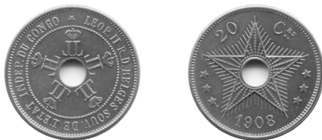
20 centiem 1908, kopernikkel, Congo-Vrijstaat

Daarnaast aanvaarde de bevolking liever de vreemde munten in plaats van deze van de Congo-Vrijstaat, zoals het Portugese geld in Beneden-Congo en de thaler in Oost-Congo en bovendien aanvaarden zij zelfs liever penningen uitgegeven door privé-ondernemingen. In Beneden-Congo bvb. kon men penningen vinden van de Nederlandse bedrijven van een zekere A. Greshoff en in de streek van het Tanganyikameer werden er zinken penningen gebruikt uitgegeven door de Witte Broeders, dewelke in gebruik waren tot op het einde van de Eerste Wereldoorlog. Over het algemeen was het een moeilijke taak om geld te introduceren als basis voor de handel. Munten en bankbriefjes werden niet onmiddellijk aanvaard, alleen de toen veel gebruikte “goed voor...” briefjes geraakten vrij snel ingeburgerd, hoewel deze praktijk een negatieve invloed had op het monetair systeem. In het jaar dat koning Leopold II de overdracht van de Congo-Vrijstaat aan België tekende waren de mitakos, Katangakruisen, zoutstaven, stoffen enz. in zulke mate in gebruik, dat op het einde van 1908 er nog 1.275.439 nikkelmunten van 20, 10 en 5 centiem in de kelder van de Munt van de Congo-Vrijstaat in Brussel gestockeerd waren.