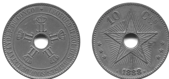
10 centiem 1888, koper, Congo-Vrijstaat

De eerste bankbriefjes werden gedrukt in 1896 en later werd er een set van 5, 10 en 20 centiem in kopernikkel ingevoerd, dewelke gebruikt werden om de arbeiders te kunnen betalen in geld in plaats van in “natura”. De betaling in “natura” was nogal ingewikkeld wanneer vele arbeiders moesten uitbetaald worden zoals dat het geval was in de kopermijnen van Katanga bvb. Aangezien de invoering van geld in de kolonie niet van een leien dakje liep, werd de Bank van de Congo-Vrijstaat gedwongen om een officiële koers te geven aan bepaalde ruilobjecten. In 1886, kreeg de “mitako”, een messing draad van ongeveer 50 cm lang, een waarde toegekend van 15 centiem. Deze waarde werd herzien in 1893 en gelijkgesteld aan de waarde van 10 centiem, een grote kopermunt op dat ogenblik, dat de geldintroductie moest vergemakkelijken in de meest teruggetrokken gebieden. Deze werd nog eens in 1901 herzien aangezien deze objecten zeer gevoelig waren aan inflatie.