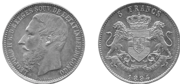
5 frank 1894, zilver, Congo-Vrijstaat, Leopold II

Het is in de Congostreek dat de “wedloop” voor Afrika begon en waar de plundering van het hele continent een zeer lucratieve handel werd. De Congostreek, nu de Democratische Republiek Congo is één van de grootste landen van het continent met een oppervlakte van 2.345.409 km 2 , vergelijkbaar met één vierde van de totale oppervlakte van Europa.