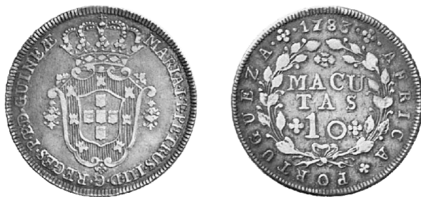
10 macutas 1783, zilver, Portugese periode

In 1762 gaf koning Jozef I de toelating om kopermunten 5/ te slaan met het koninklijke wapen en het woord “macuta”. De macuta was een oude ruilwaarde gekend in West-Equatoriaal Afrika; de naam zelf zou afkomstig zijn van stofgeld (uit rafiavezels) gebruikt voor handelsdoeleinden door de volkeren uit het gebied van het huidige Zuid-Angola. Dit was de eerste poging om een variabele rekeneenheid te vervangen door een Europese munt met een vaste waarde (50 reis of halve teston). Dit werd herhaald in 1814 en in 1860. De fracties van de macuta waren uit koper, de veelvouden (tot 12 macutas) waren uit zilver geslagen. Vanaf de 19 de eeuw werden de dubbele en 4 macutas ook uit koper geslagen ten gevolge van de afnemende invloed van Portugal in Afrika en werd het aantal in Porto geslagen macutas te groot voor de bescheiden behoefte in Afrika 6/ .