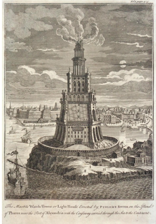
The Marble Watch-Tower or Light-House Erected by PTOLEMY SOTER on the Island of Pharos near the Port of Alexandria with the Conflagration carried through the Sea to the Continent.

Een late legende vertelt dat Sostratos, om het bouw materiaal voor de basis te beproeven, monsters ervan in zee wierp om hun graad van slijtage te onderzoeken en hij op basis van de resultaten besloot om blokken glas te gebruiken voor de grondvesten (in werkelijkheid was het fundament van graniet). Volgens Plinius de Oudere kostte de bouw 800 talenten zilver (ca. 12 miljoen €) en kreeg Sostratos de toelating van Ptolemaeus II om zijn naam erop aan te brengen, wat als een zeer grote eer moest beschouwd worden. Anderzijds vertelt Loekianos van Samosata dat die naamvermelding in het geniep gebeurde: Sostratos zou de zinnen 'Sostratos van Knidos, zoon van Deixippos, aan de reddende goden, voor de zeevarenden' aangebracht hebben en die vervolgens hebben bedekt met een kalklaag. Daarop zou dan de 'officiële' tekst met verwijzing naar Ptolemaios II aangebracht zijn. In de loop van de tijd, lang na de dood van zowel Sostratos als Ptolemaios II, zou de kalklaag verweerd zijn waarbij de onderliggende tekst zichtbaar werd. Moeilijk te geloven dat niemand dit zou opgemerkt hebben als, zoals Loekianos vermeldt, de letters ca. 40 cm hoog waren!