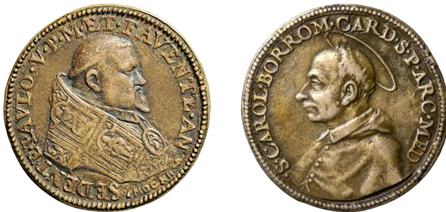
Paus Paulus V en Sint-Carolus Borromeus, 1612, brons Ø 40 mm