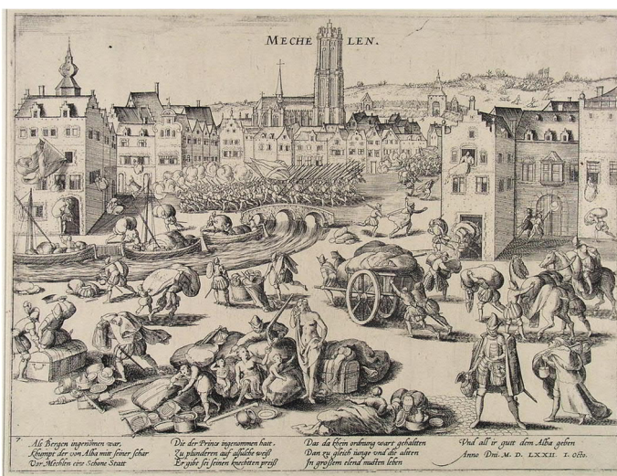
Frans Hogenberg – De Spaanse Furie in Mechelen – 1572

Aanvankelijk trokken de Lage Landen of de Zeventien Provinciën gezamenlijk op tegen de Spaanse overheerser. In 1566 raasde de beeldenstorm door ons land en in grote delen van de Nederlanden werden vernielingen aangericht in kerken en kloosters door rondtrekkende groepjes. Het vandalisme was gericht tegen de rijkdom van de katholieke kerk en de beeldenverering. Vooral heiligenbeelden, altaren en monstransen moesten het ontgelden.