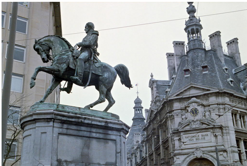
Ruitersstandbeeld van Leopold I aan de Leopoldplaats te Antwerpen