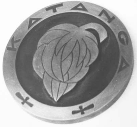
Maquette vz, koper Ø 10 à 15 cm

In 1960 scheurde Katanga zich af van Congo. Charlier werd benaderd door minister van Financiën Jean-Baptiste Kibwe en gevraagd munten voor Katanga te ontwerpen. Hij maakte een groot papieren ontwerp van de voor- en keerzijde voor een 5 en 1 frankstuk, evenals een maquette in koper van de voorzijde in 3 exemplaren, 10 à 15 cm diameter. Via een vertegenwoordiger van het Engelse bedrijf ICI (Imperial Chemical Industries) verlieden de contacten met Engeland om de munten daar te laten slaan. Het ontwerp werd voorgesteld aan president Tshombe die de zaak goedkeurde. Helaas kreeg Charlier het ontwerp en de maquettes nooit terug, maar er zijn wel foto's van bewaard gebleven, hier afgebeeld. De munten werden door de Munt van Birmingham geslagen en in 1961 in omloop gebracht. Er werd ook een gouden afslag van de 5 frank gemaakt.