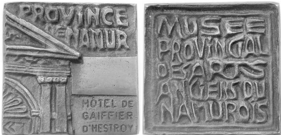
Medaille Musée provincial des Arts anciens du Namurois, gegoten brons, 75 × 76,5 mm

Sinds zijn pensionering bleef hij zijn kunsten nog steeds uitoefenen: hij maakte reeds drie gegoten bronzen medailles voor bevriende instellingen. Hierbij afgebeeld de medaille die hij maakte voor het Musée provincial des Arts anciens du Namurois te Namen in 2005.