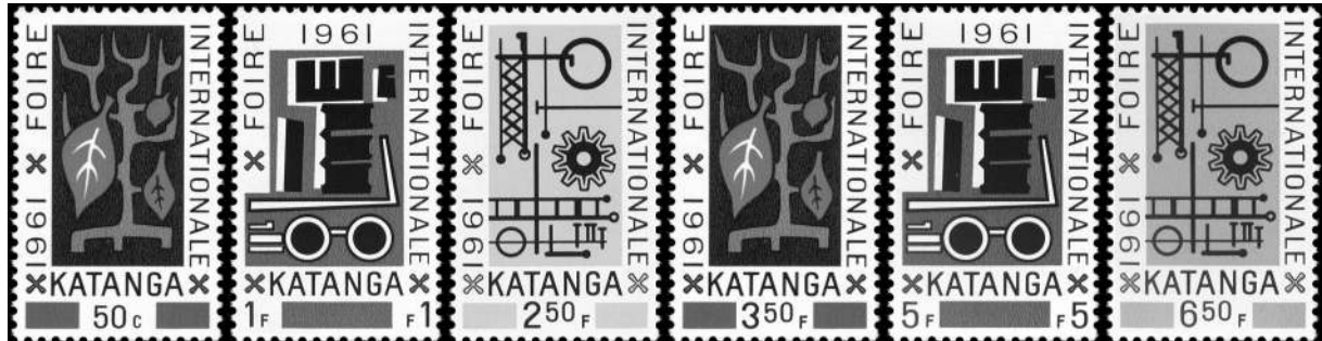
Postzegels van Katanga, Foire Internationale 1961, ontworpen door Claude Charlier Gedrukt door Hélio Courvoisier s.a., La Chaux-de-Fonds, Zwitserland

Katanga floreerde korte tijd goed en het hoogtepunt ervan was de Foire Internationale in juli 1961 te Elisabethstad. Deze moest de mijnactiviteiten in de verf zetten.. Bij die gelegenheid werd ook een wedstrijd georganiseerd voor het ontwerpen van postzegels waaraan Charlier deelnam en won. Zo werden zes zegels “Foire Internationale 1961” uitgegeven met drie verschillende motieven: landbouw, transport en industrie. Iedere postzegel toont ook drie katangakruisen, het symbool van Katanga. Ze waren destijds ook in België verkrijgbaar voor verzamelaars. Merk op dat de munten ook drie katangakruisen tonen: twee op de voorzijde en een op de keerzijde.