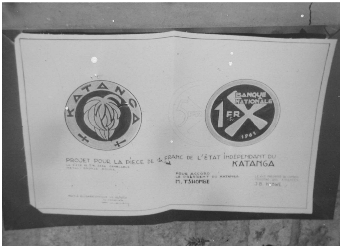
Het ontwerp van de munten van Katanga, (in dunne lijnen ook de 5 frank) met onderaan plaats voor de handtekeningen van Tshombe en Kibwe