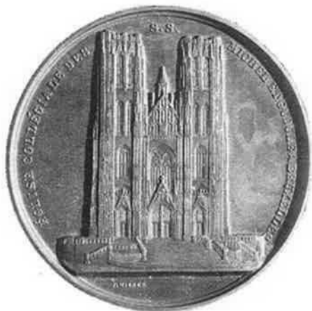
(1) Ontworpen in samenwerking met Charles Wiener.