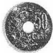
Albert 50 centiem A. Michaux Kz.