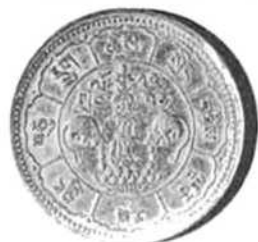
10 SANG (10 in cijfers)