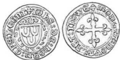
JAN VAN HORNES : ZWARTE PENNING GESLAGEN TE WEERT DE CHESTRET n° 426.

Jan van Horne muntte te Luik, Hasselt, Sint Truiden en gedurende enkele maanden van het jaar 1499 te Weert in de heerlijkheid van Hornes. Hij liet florijnen met St. Lambertus en met St. Jan slaan. Ze droegen op de keerzijde vier schildjes, waarbij dat van het markizaat Franchimont. Onder de zilveren munten treffen wij aan : helm en halve helm ; patard en halve patard ; enkel- en dubbel vuurijzer, ook tal van koperen denieren.