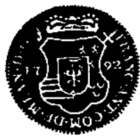
SEDE VACANTE 1792 : SCHELLING

Vertaald in het Nederlands door P. P. F. J.