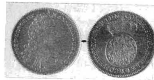
MAXIMILIEN-EMMANUEL DE BAVIERE : QUART D'ÉCU 1713. Chalon 262 — De Mey 38

Le commencement de ce siècle est marqué par la guerre de la succession d'Espagne. Philippe V, roi d'Espagne, après la prise par les Alliés d'une partie de la Belgique, se réfugie à Namur, dans ses terres non encore envahies, en 1709. Il fit ouvrir l'atelier monétaire pour payer la solde de ses troupes et il favorisa ainsi le commerce à Namur et dans les environs. Après la cession de ses États, en 1711, à Maximilien-Emmanuel de Bavière, celui-ci continua la frappe des monnaies mais l'or et l'argent ne sont à proprement parler que des pièces d'apparat, servant de cadeaux ; en effet, ces monnaies sont toujours à fleur de coin, seule la menue monnaie d'argent et de cuivre sert à la circulation. A ce moment, en 1714, l'atelier de Namur ferme ses portes. De Philippe V nous avons en argent : des escalins (79) ; en cuivre : des pièces de deux (80) et de un liard (81) . Maximilien-Emmanuel de Bavière frappe en or : des souverains (82) et des doubles (83) , en argent : des écus (84) , des demis, des quarts, des escalins et le demi ou plaquette (85) et, en cuivre, des liards (86) .