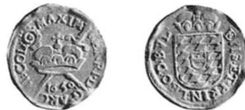
MAXIMILIAAN-HENDRIK VAN BEIEREN : OORD

Na voornoemde bekomt een derde lid van het huis van Beieren de bisschoppelijke zetel, nml. Maximiliaan-Hendrik van Beieren (1650-1688). Hij verliest het hertogdom Bouillon , en sloeg dubbele en enkele dukaten in goud ; ducaton, patagon en halve patagon in zilver, ook schellingen en plaketten in zilver ; oorden en halve oorden in koper.