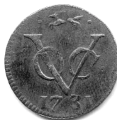
Duit van Gelderland 1731, geslagen te Harderwijk