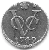
Duit van Holland 1749, geslagen te Dordrecht