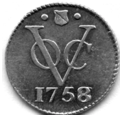
Zilveren duit van Utrecht 1758 (over 1756), geslagen te Utrecht