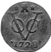
Duit van Zeeland 1728, geslagen te Middelburg