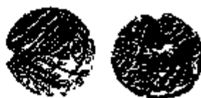
Gouden stater van de Trevicren