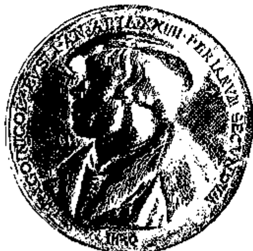
Houten portretpenning van Nikolaas van Busleyden, vervaardigd door Janus Sa- cundus in 1530.