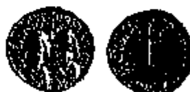
Gouden solidus van Heraclius consul, Car- thago, 609-610.