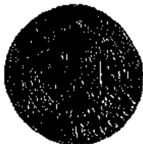
Gouden dubbele soeverein van Karel II, Brabant, Brussel, 1668