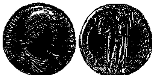
Stuk van 4 solidi van Valentinianus I, Antochië.