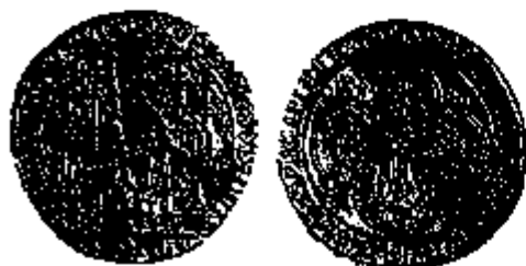
Gouden schild van Wale- rand III van Luxemburg, Ligny en Saint-Pol, 1371-1415