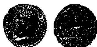
Gouden aureus van Ha- drianus, Rome, 125-128.