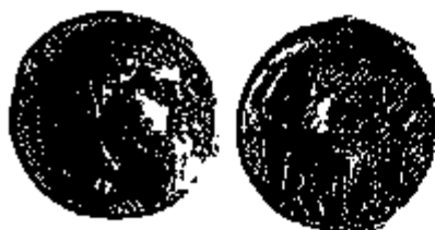
Tetradrachme van Etna, uitgegeven in Catana door Hieron van Syra- cuse (476-461 v.K.)