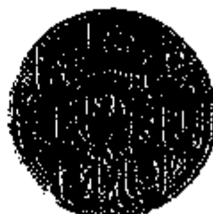
Gouden penning vervaardigd in 1608 op last van de pro- vincie Zeeland voor de wa- penbestandsvoorstellen.